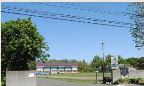
当別町立西当別中学校