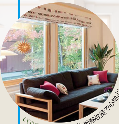
COMFORT 高い気密・断熱性能で心地よい暮らし