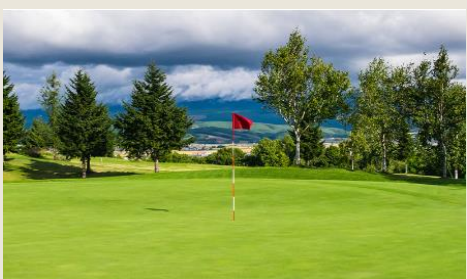
スウェーデンヒルズゴルフ倶楽部