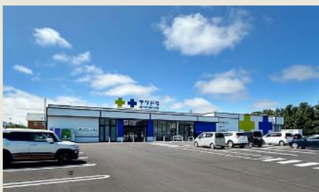
サツドラ当別太美店