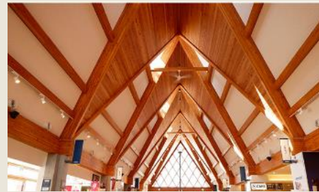
北欧の風 道の駅とうべつ