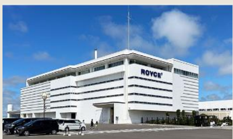
ロイズタウン工場