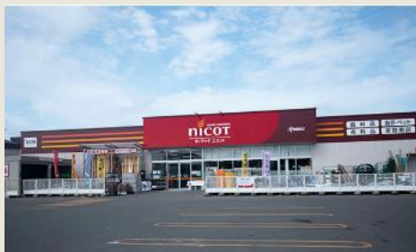
DCMホームマックニコット太美店