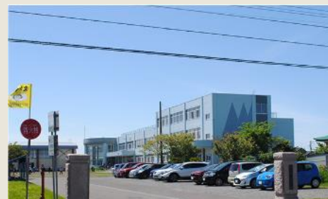
当別町立西当別小学校