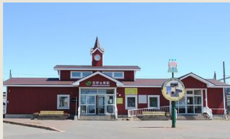
JR学園都市線太美駅