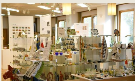
スウェーデン交流センター