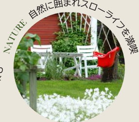
NATURE 自然に囲まれスローライフを満喫