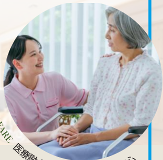
WELFARE 医療融合の街づくりで老後も安心

札幌や他地域からの移住、2拠点生活の実情などもご説明します。当別町役場の方や移住された方のお話も交え、当別暮らしの便利さ・楽しみをお伝えします！