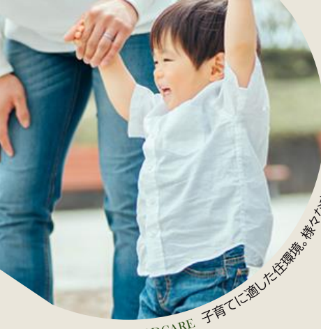
CHILDCARE 子育てに適した住環境。様々な支援策も